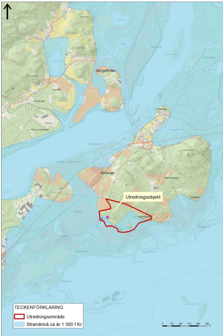
Figur 2. Utredningsområdet och föreslaget objekt för steg 2 utredning i förhållande till strandnivån kring år 1500.f.Kr.