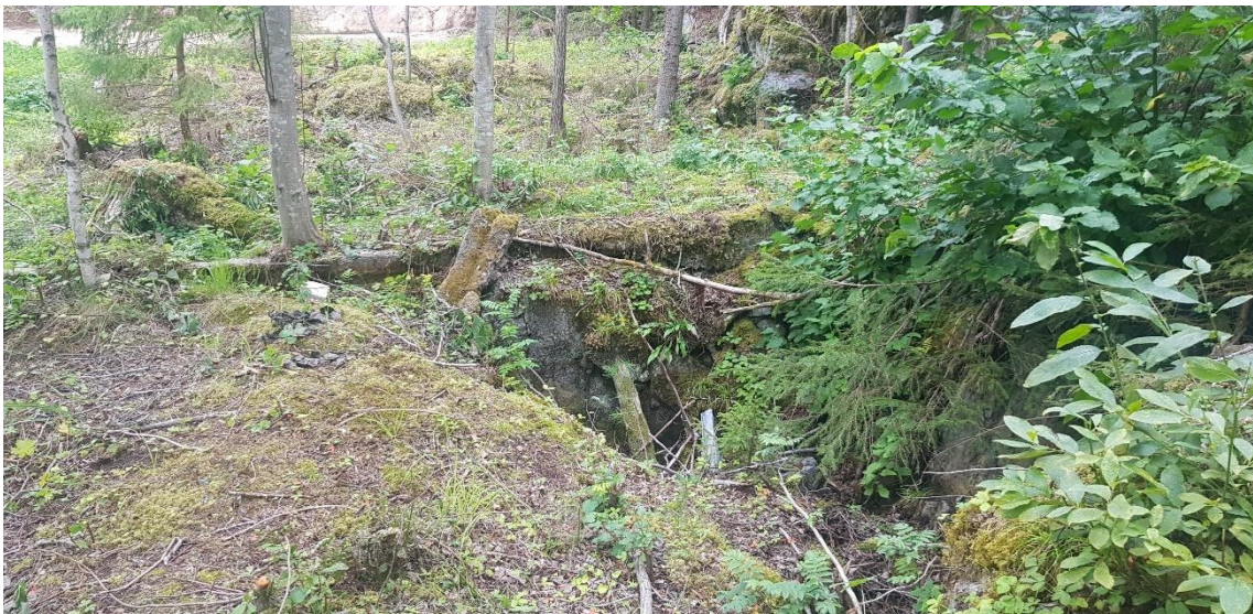
Figur 4. Sweco 2 är en förmodad husgrund cementsyll anlagd mot bergvägg och med en källargrop.