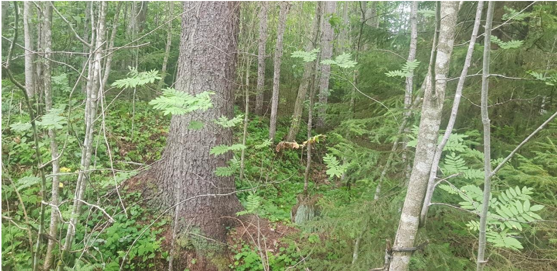
Figur 5. Kolbotten efter resmila (Sweco 3) med omgivande dike/stybbgropar.