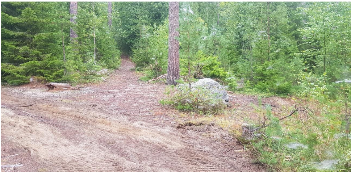
Figur 6. Boplatsläge i en sandig sluttning vid kustlinjen i början av bronsåldern.