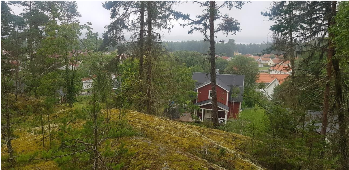
Figur 3. Vy från utredningsområdets sydvästra del.